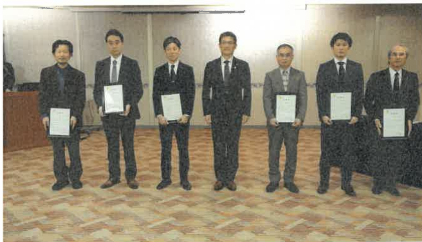
宮崎県MICEアンバサダー