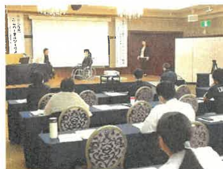
ユニバーサルツーリズム研修会