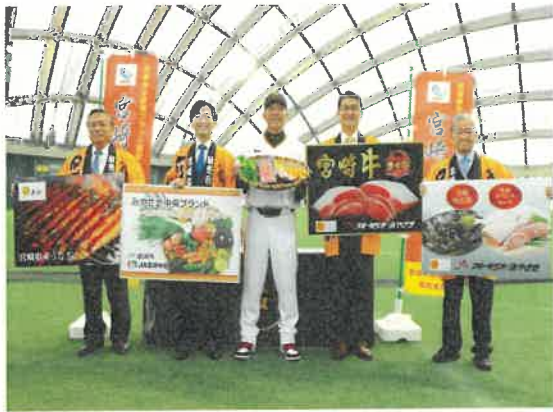
読売巨人軍春季キャンプ