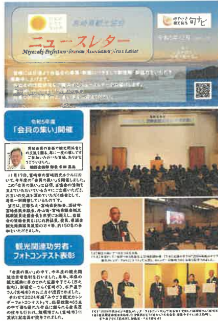
ニュースレター（9月号、12月号）