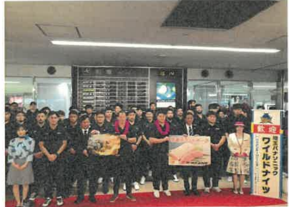
埼玉パナソニックワイルドナイツ 11月合宿