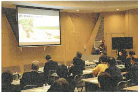
塾生によるプレゼンテーション