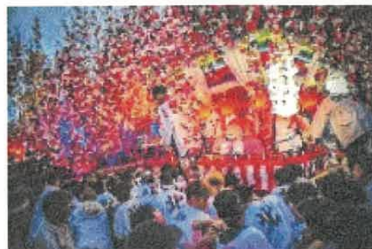
「みやざき観光カレンダー2024」フォトコンテスト最優秀賞作品