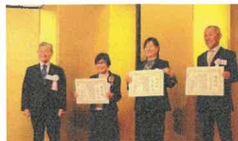
「宮崎県観光協会観光功労者表彰」