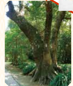
御神木のクスノキの根元は、たくさんの方が触ってツルツルに。

〒880-0835 宮崎県宮崎市阿波岐原町産母127番地 ☎ 0985-39-3743