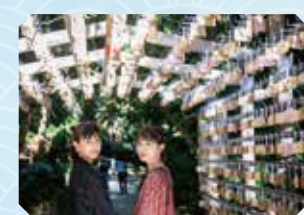
拝殿脇の小道をたどった先にある、元宮。ピロウ樹などの亜熱帯の植物が生い茂り、ひょっこり精霊が現れそうな神秘的な気配の中心に鎮座する。