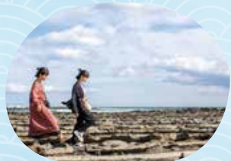
波の形をした奇岩が延々と続く、鬼の洗濯板。広々とした景色や、潮だまりの愛らしい小魚やエビ、カニを楽しめる干潮時がオススメ。