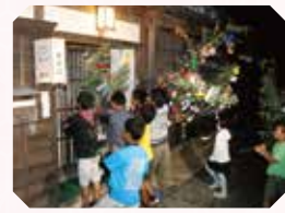
旧暦8月1日の夜、子どもたちが各家の戸を「起きよ、起きよ」と叩いて回るおきよ祭り。