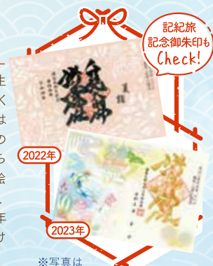
※写真は2022・2023年のものです。今年度もお楽しみに!

〒889-2403 宮崎県日南市北郷町北河内8901番地1 ☎0987-55-3252