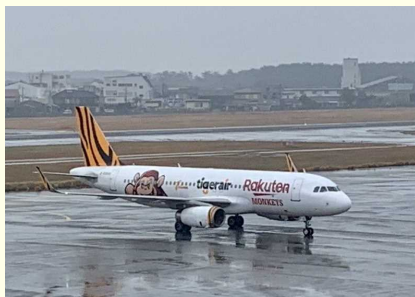
宮崎ブーゲンビリア空港に到着した台湾からのチャーター便とロビーでの歓迎の様子