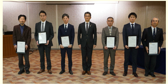
河野知事(中央)とMICEアンバサダー委嘱された皆さん

委嘱を受けたのは、 MICEの開催地決定 等に大きな影響力を 持つ大学教授の方々 で、今後、アンバサダーと協力して、積極的な誘致活動を通じて、本 県でのMICE開催件数の拡大を図っていきます。