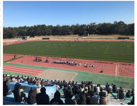
(左上) 読売巨人軍への特産品贈呈 (左下) 名城 大学女子駅伝部への宮崎チョウザメ等の贈呈 (右) J.League Miyazaki Camp Soccer Festival