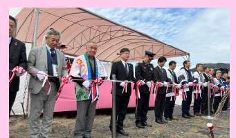
関係者によるテープカット(2/24)

第9回「延岡花物語」が開 催中です。3月20日から4 月7日までは延岡城址・城 山公園で夜桜のライトア ップも。延岡城の石垣が織 りなす幻想的な空間をお 楽しみください。