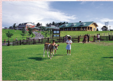
B-9 高千穂牧場 〈都城市〉乗馬や牧場内の施設見学、乳搾り等の酪農体験ができ、手作りの牧場製品も販売しています。