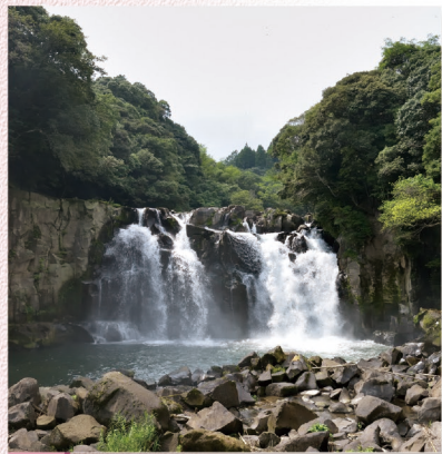
B-9 関之尾滝 〈都城市〉幅40m、高さ18mの大滝と男滝、そして女滝の3つの滝から流れる景観は、迫力満点です。