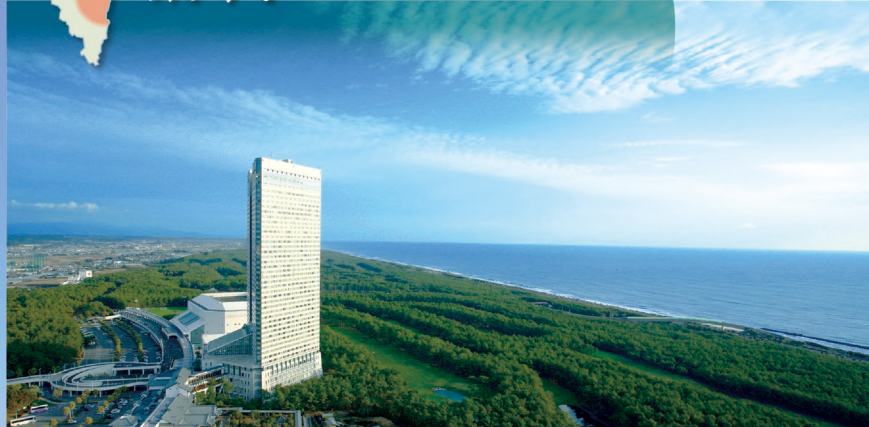
E-8 フェニックスシーガイアリゾート 〈宮崎市〉 美しい松林の中にあり、様々なタイプの宿泊施設やアクティビティを備えた滞在型リゾート基地。リゾート内には日本屈指の名門ゴルフコース「フェニックスカントリークラブ」もあります。