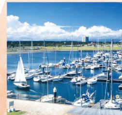
◆サンマリーナ 宮崎(宮崎市)