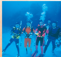
◆スキューバダイビング(延岡市、日南市)