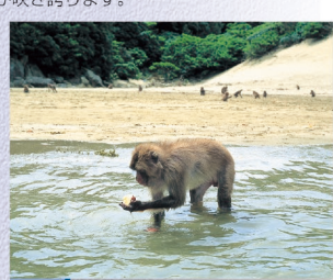
E-12 幸島の猿 〈串間市〉美しい樹林に覆われた周囲3.5kmの小島・幸島には約100匹の猿が棲息。この猿は、芋や餌を洗って食べたり、泳いだりすることで有名で文化猿とも呼ばれています。