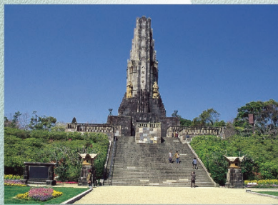
E-8 平和台公園 〈宮崎市〉

四季折々の草花に彩られ、高さ37mの平和の塔がシンボルです。園内には「はにわ園」もあります。