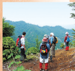
◆トレッキング(五ヶ瀬町、えびの市 他)

南北400kmに及ぶ海岸線を持つ宮崎の美しい海では、サーフィンやダイビングなどのマリンスポーツを、初心者からプロまでいたるところで楽しむことが出来るとともに、海に親しむための様々な体験プログラムが整備されている、まさに国内有数のマリリゾートです。