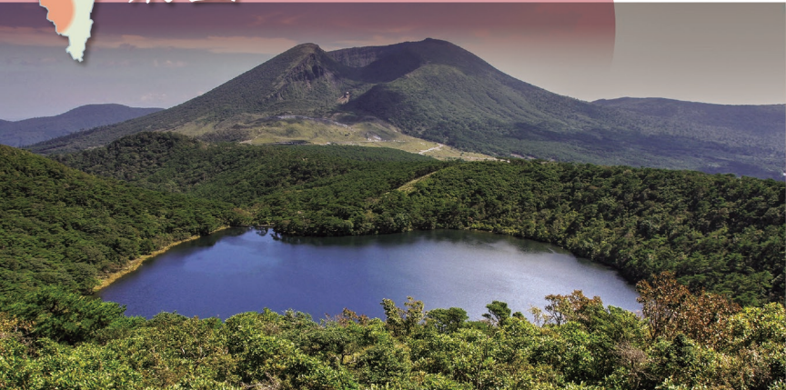
B-8 えびの高原 〈えびの市〉日本で最初に指定された「霧島錦江湾国立公園」内にあり、春のミヤマキリシマ、夏のキャンプ、秋のススキ・紅葉、冬の樹氷・スケートと、四季を通じて自然を体感できます。