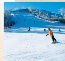
◆スキー(五ヶ瀬ハイランドスキー場)