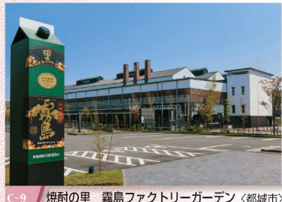
C-9 焼酎の里 霧島ファクトリーガーデン 〈都城市〉霧島酒造が運営する産業・文化・ふれあいの施設が融合したガーデンパークです。焼酎の工場見学施設「KIRISHIMA WALK FACTORY」(要予約)やレストラン・ショップを併設した「霧の蔵ブルワリー」などがあります。