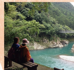
◆森林セラピー(日之影町、綾町、日南市)