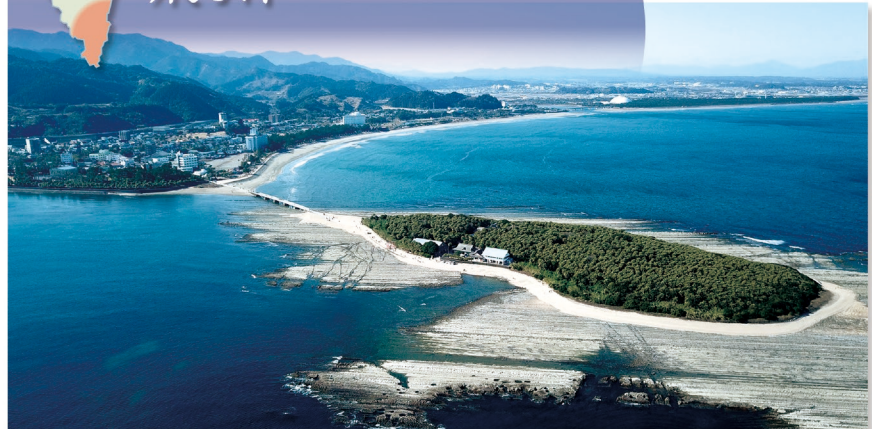
E-9 青島 〈宮崎市〉亜熱帯植物群が自生する青島。神の島として知られ、周辺には鬼の洗濯板と呼ばれる天然記念物の波状岩が広がり、自然の神秘に包まれています。近くにはボτανックガーデンもあり、様々な植物を楽しめます。