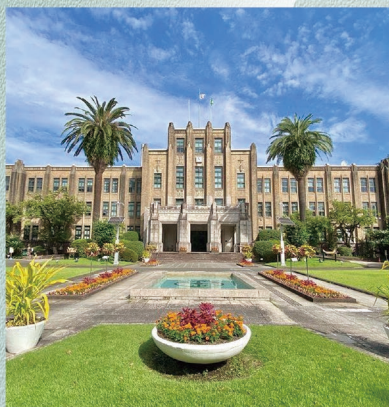
E-8 宮崎県庁 〈宮崎市〉

昭和7年建設で、九州で唯一戦前から残る県庁舎は、国の有形文化財に登録されており、ネオゴシック様式の重厚な外観が印象的です。