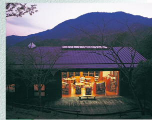
E-6 木城えほんの郷 〈木城町〉

西都原古墳群全体を野外展示とらえるフィールドミュージアムで、楽しみながら考古学を勉強できます。