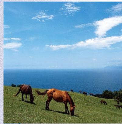
E-12 都井岬 〈串間市〉本島の最南端に位置する都井岬。雄大な自然の中で野馬馬のんびり草を食む風景は、旅人の心を和ませます。