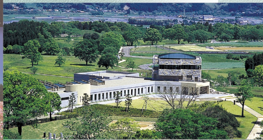
E-7 西都原考古博物館 〈西都市〉

西都原古墳群全体を野外展示とらえるフィールドミュージアムで、楽しみながら考古学を勉強できます。