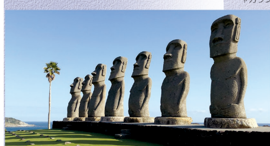
E-10 サンメッセ日南 〈日南市〉イースター島(チリ)の正式許可を得て世界で初めて実現した、7体のアウ・アキビ完全複製モアイ像がシンボルとなっており、ユネスコ世界遺産のパネルも屋外展示しています。