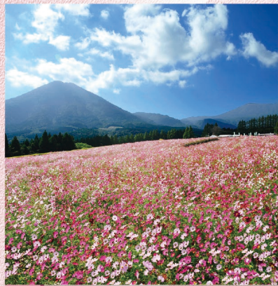
B-8 生駒高原 〈小林市〉雄大な霧島連山と九州山地が見渡せ、春は菜の花やアイスランドポピー、秋はコスモスが咲き乱れる花の高原として有名です。