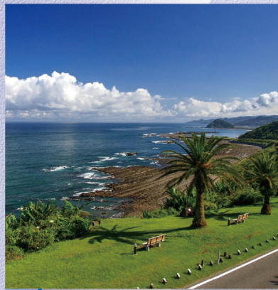
E-9 堀切峠 〈宮崎市〉沿道にはフェニックスの並木が続ぎ、眼下には日向灘を望める日南海岸唯一の景勝地です。