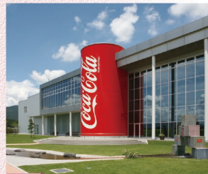
A-7 グリーンパークえびの 〈えびの市〉自然との調和を考え、フラワーガーデンや遊歩道も整備されたコカ・コーラの公園工場。最新鋭の工場見学の他、コカ・コーラのコレクションギャラリーやショップもあります。