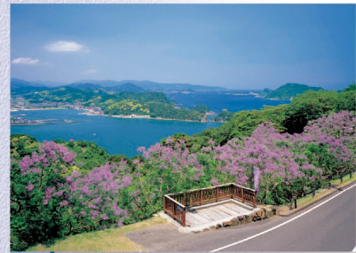
E-11 ジャガランダの森「道の駅なんごう」 〈日南市〉日南海岸国立公園の美しい海岸線の景色を一望できる絶好のロケーション。夏には特産のマンゴーなども販売されています。5月下旬～6月は「紫の桜」と言われるジャガランダが咲き誇ります。