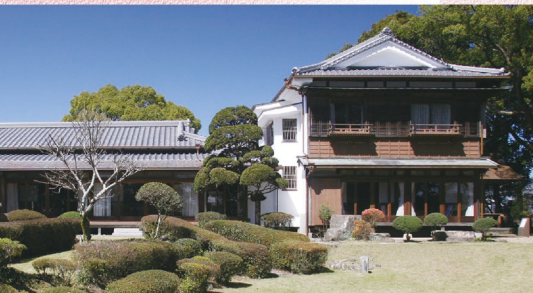
C-10 都城島津邸 〈都城市〉都城島津家の本宅(国の登録有形文化財)と併設する資料館で、650年にも及び同家と都城市の悠久の歴史を感じることができます。