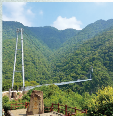
D-7 綾の照葉大吊橋 〈綾町〉

昭和7年建設で、九州で唯一戦前から残る県庁舎は、国の有形文化財に登録されており、ネオゴシック様式の重厚な外観が印象的です。