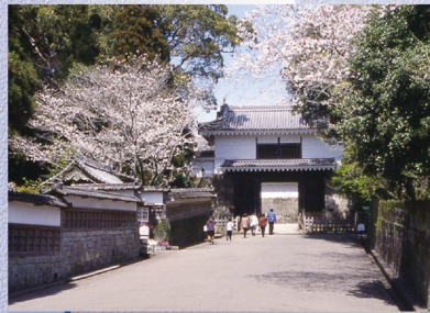
E-10 飢肥城下町 〈日南市〉伊東藩五万一千石の城下町として栄え、町には石垣や武家屋敷等が残っています。飢肥城跡や歴史資料館、小村寿太郎記念館もあります。