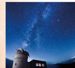
◆星空ウォッチング(都城市、美郷町、他)

県土に占める森林面積が九州一の宮崎には、長年守り続けてきた美しい自然が広がり、九州山地をはじめとする山々や渓谷の緑を、体力に応じて一年中楽しむことが出来ます。また、豊かな自然に育まれた澄んだ空気は、日本一に何度も選ばれた美しい星空も楽しませてくれます。