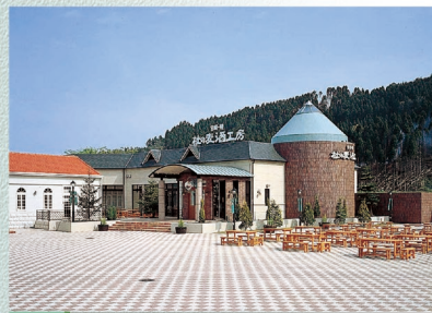
D-8 蔵元 綾 酒泉の杜 〈綾町〉

四季折々の草花に彩られ、高さ37mの平和の塔がシンボルです。園内には「はにわ園」もあります。