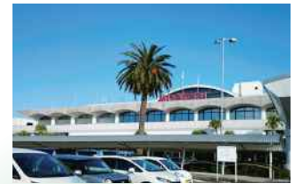
宮崎ブーゲンビリア空港 MIYAZAKI BOUGAINVILLE AIRPORT