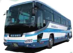
宮崎交通 MIYAZAKI KOUTSU/BUS