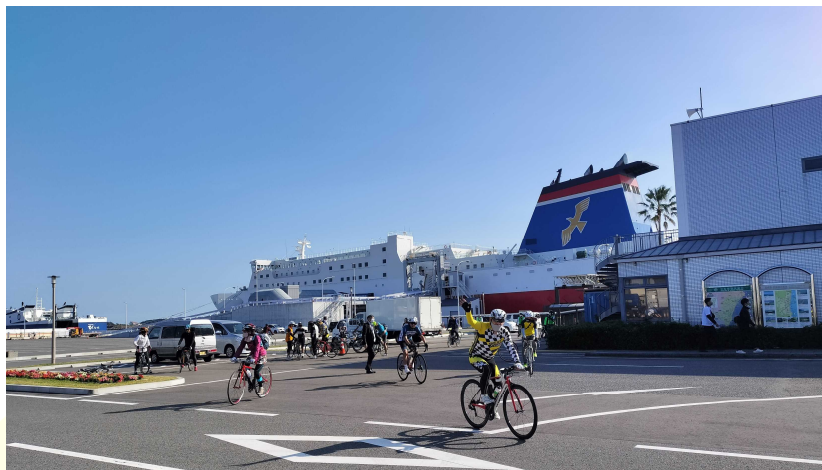
秋晴れの下、宮崎港から西都原古墳群を目指してスタートする参加者たち

ウクライナからの避難民の方の参加もあり、参加者たちは、秋晴れの暖かい気候の下、宮崎の景色を満喫していました。