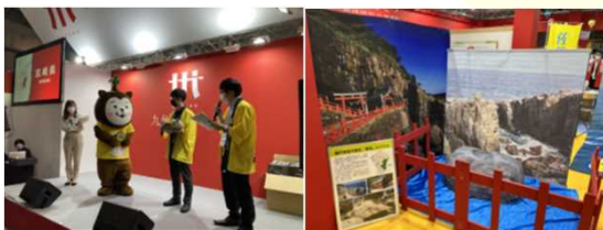
(左) ステージで頑張る「みやぎき犬」むっちゃん (右) 大人気だった運玉投げ体験

一方、MICE誘致に関しても、9月に東京で、九州・沖縄地区のコンベンションビューロー合同でのプロモーションを実施しました。今後、会議等を予定している学協会関係者等に対し、本県の優れたMICE環境をアピールするなど、積極的な誘致活動を行いました。