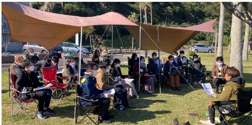
(左) 10月25日に行われた開講式の様子。(上) 12月7日、基礎コース第5回「宮崎の魅力再発見」の講義は宮崎白浜キャンプ場の青空の下で。

この塾は、豊かな宮崎の未来を築くため、これからの本県観光を担う人材を発掘・育成し、更なる成長を目指して実施するもので、国内各地で活躍する講師陣を迎え、充実したカリキュラムで構築されています。今年度は基礎コースに26名、実践コースに8名が参加しており、受講生の皆さんは講師陣の指導の下、2月3日の修了式に向け、熱心に学んでいます。