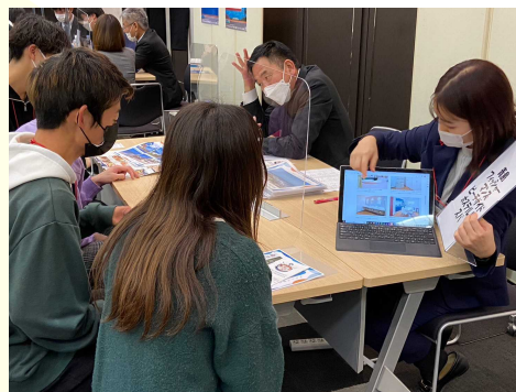
スポーツ合宿誘致セミナー（大阪市）の様子

今年は11月28日に大阪市で開催し、関西地区の大学サークル19団体・36名の参加者に対し、本県のスポーツ環境や観光情報などをPR。更なるスポーツランド推進を目指しています。