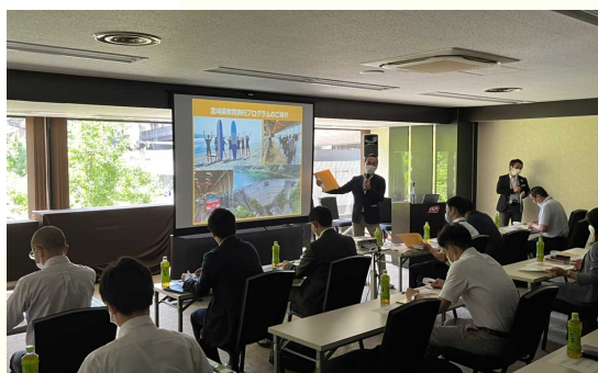
2日間のセミナーで、本県の教育旅行素材を紹介

宮崎カーフェリー新船「フェリーたかちほ」の就航を契機として、関西地区からの教育旅行の一層の誘致推進を図るため、6月27日、28日、神戸市と大阪市において、関西地区の大手旅行会社の教育旅行担当者を対象に、本県の教育旅行素材を紹介するセミナーを開催しました。