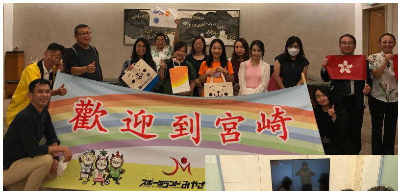
ようこそ宮崎へ。香港からのツアー客を歓迎

日本政府は、10月11日から観光目的の個人旅行による入国を再開する方針を発表しました。当協会では、それに先立ち8月29日、30日に韓国を訪問し、アジアナ航空ソウル支店や大手旅行会社とインバウンド再開に向けた意見交換を行いました。また、9月2日には、帰国後の隔離条件があるにもかかわらず、香港から2年半ぶりとなる、日本送客最大手「EGLtours」の九州ツアーの旅行者8名が来県。高千穂峡など本県の魅力を堪能されました。