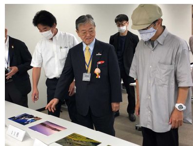
審査の様子。力作揃いに、審査員は大いに頭を悩ませていました