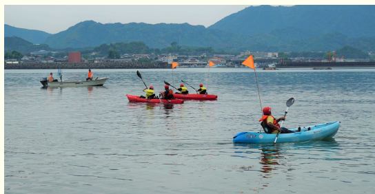
シーカヤック (門川町)

昨年度「新しいニーズに対応した観光地域づくり支援事業費補助金」を7事業者に交付し、県内各地の観光地域づくりを支援しました。このうち門川町では、町内の小学5年生38名が遠足で早速シーカヤックを体験するなど、新たな取組みが始まっています。