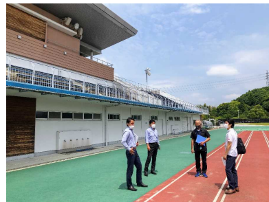
宮崎市生目の杜陸上競技場

4月15日の宮崎カーフェリーの新船就航を受け、5月24日から、大学生や社会人チームのスポーツ合宿等を取り扱う関西・中部地区の旅行代理店の担当者、新船「フェリーたちほ」に実際に乗船して宮崎