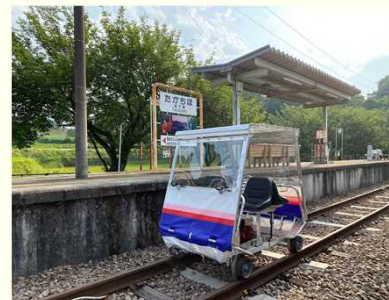
スーパーカート (高千穂町)

昨年度「新しいニーズに対応した観光地域づくり支援事業費補助金」を7事業者に交付し、県内各地の観光地域づくりを支援しました。このうち門川町では、町内の小学5年生38名が遠足で早速シーカヤックを体験するなど、新たな取組みが始まっています。