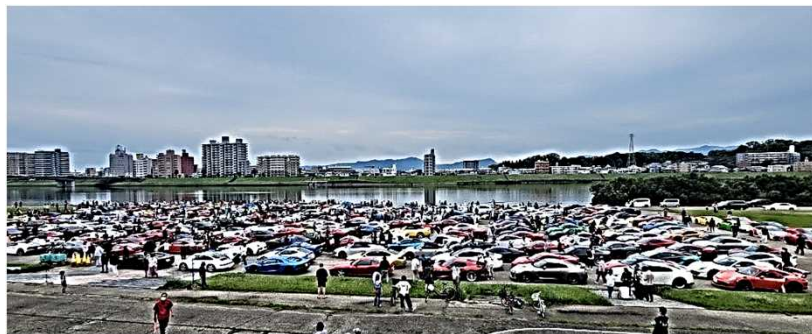
(上)宮崎市大淀川河川公園に勢揃いしたスーパーカー (右)ツーリングの様子

参加者等約500人が県内に宿泊したこの催しに対し、当協会は運営の一部を支援、また、参加者に観光パンフレットやノベルティグッズ等を提供し、本県の観光をPRしました。