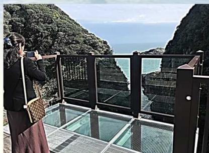
(上) 馬ヶ背展望スペース (右) 霧島ファクトリーガーデン (左下) 意見交換の様子