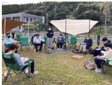
実地研修(宮崎白浜キャンプ場)