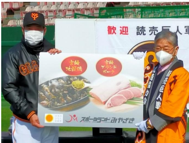
読売巨人軍 原辰徳 監督 米良会長

公益財団法人宮崎県観光協会 TEL.0985-26-0530 / 宮崎県観光推進課スポーツランド推進室 TEL.0985-26-7108