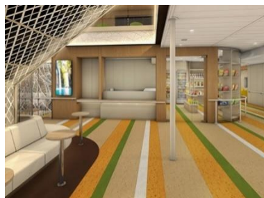
インフォメーション・ショップ