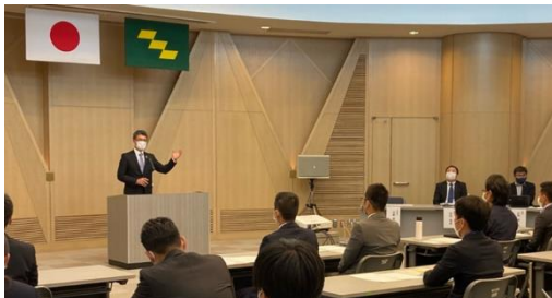
開講式(県電ホール)