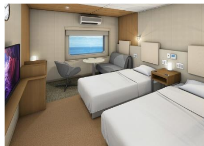
客室：プレミアムツイン