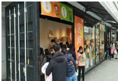
南九州ポップアップストア・宮崎県