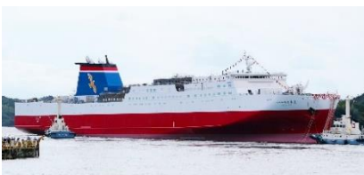
フェリーたかちほ

新しい船は個室が大幅に増えるなど、最近の個人旅行ニーズなどに応えられるようになっており、魅力がアップします。満天の星空や波音、潮の香りを感じながら、家族や友人と、ゆったりとした船旅を楽しむことができます。