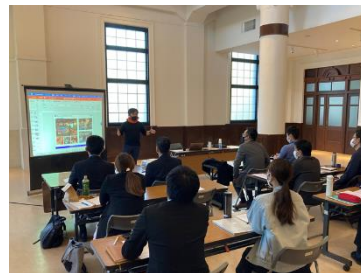
マネジメント講座(県庁5号館)