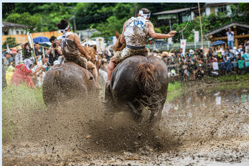
7月 御田祭 (美郷町)