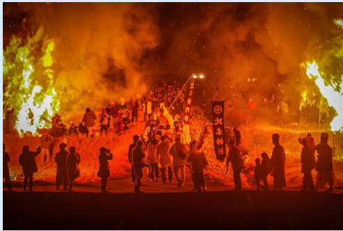
1月 春を呼ぶ (美郷町)