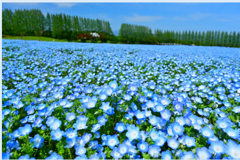
4月 ネモフィラの海 (小林市)