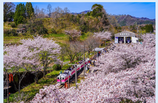
3月 春のあまてらす鉄道 (高千穂町)