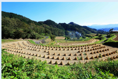
11月 稲わら干し (高千穂町)