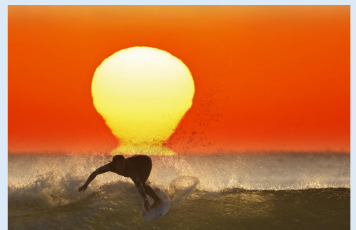
12月 朝陽を浴びて (日向市)