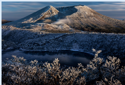
2月 冬季に映る原風景 (えびの市)