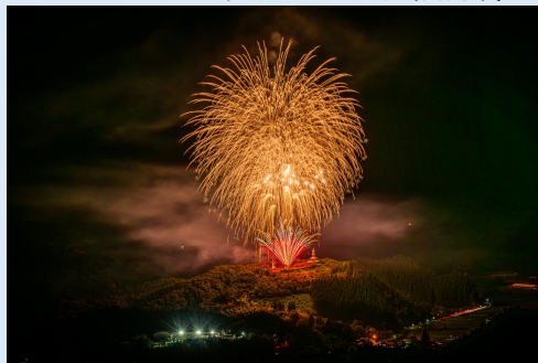
8月 故郷の花火 (美郷町)