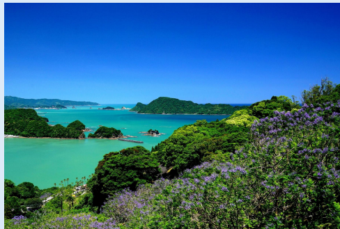
5月 日南市なんごうの ジャカラダと空と海 (日南市)