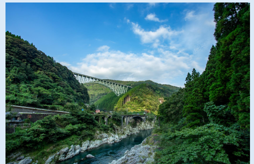
9月 旧綱ノ瀬橋梁 (日之影町)