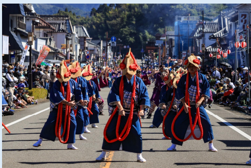
10月 天下泰平 (日南市)