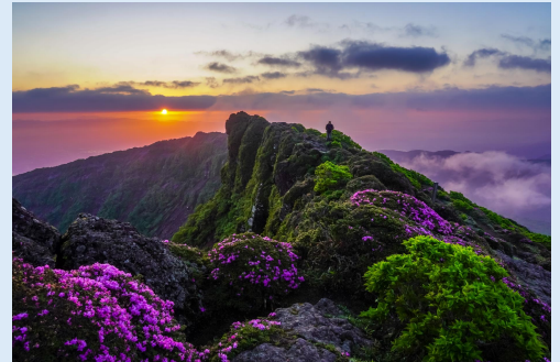
6月 ミヤマキリシマ咲く霧島山の朝 (えびの市)