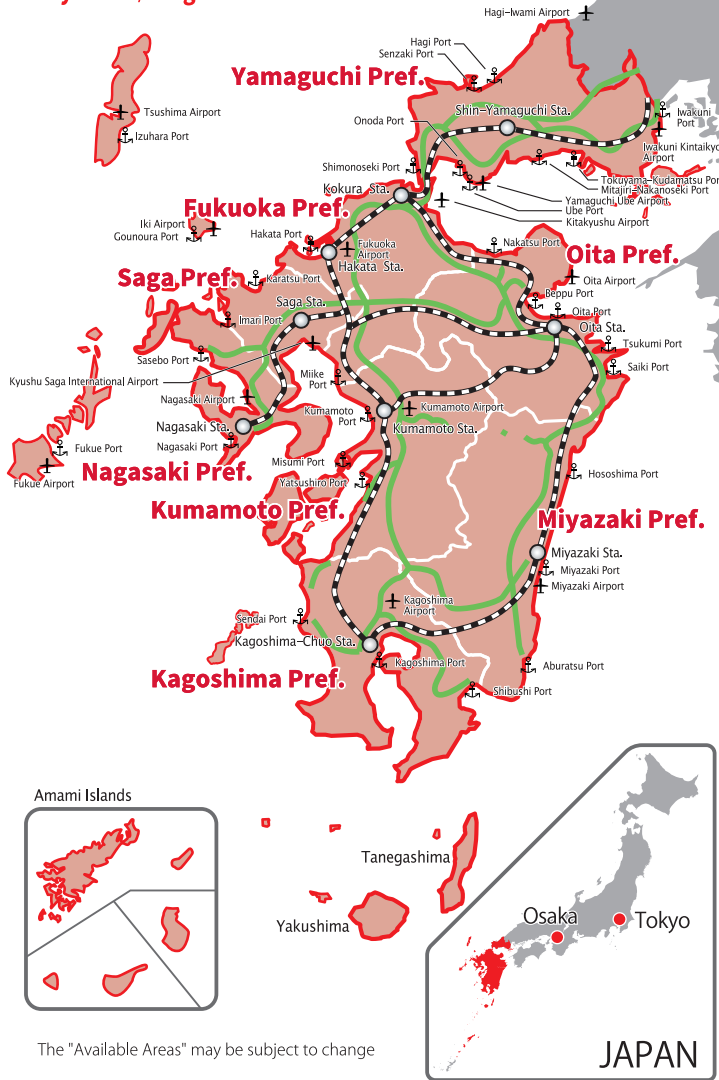
The "Available Areas" may be subject to change

Yamaguchi / Fukuoka / Saga Nagasaki / Kumamoto / Oita Miyazaki / Kagoshima