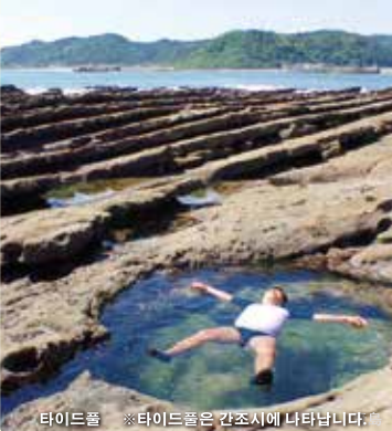
타이드폴 ※타이드풀은 간조시에 나타납니다.