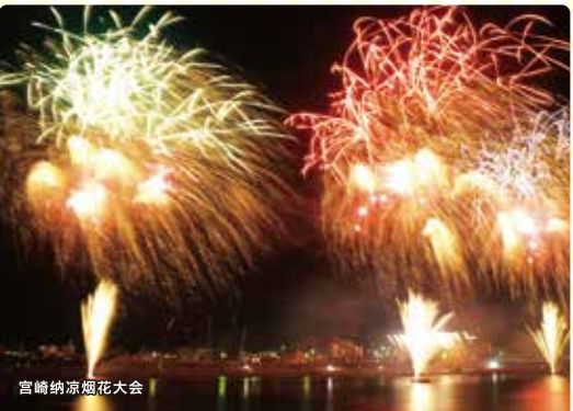
宫崎纳凉烟花大会